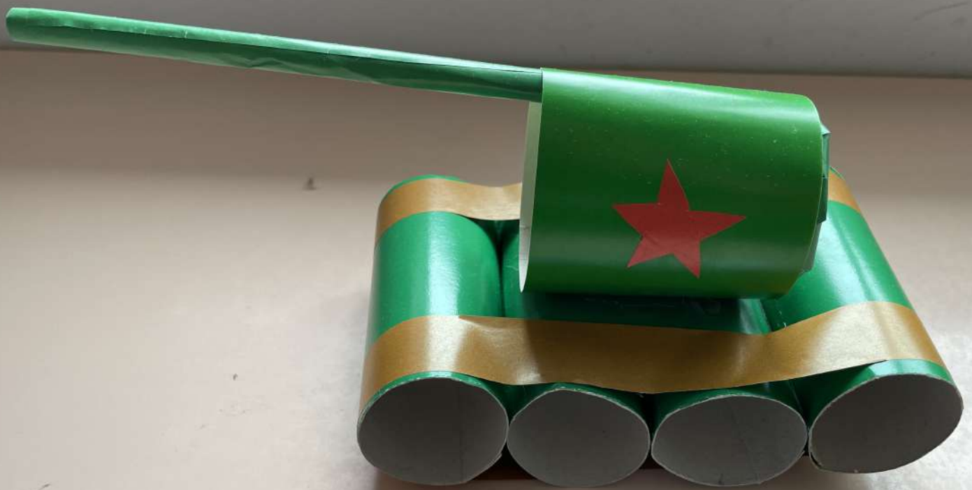
Клачун Денис ст. гр.