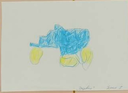
„Tropfen“ Seite 7