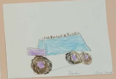
„Tropfen“ Seite 12