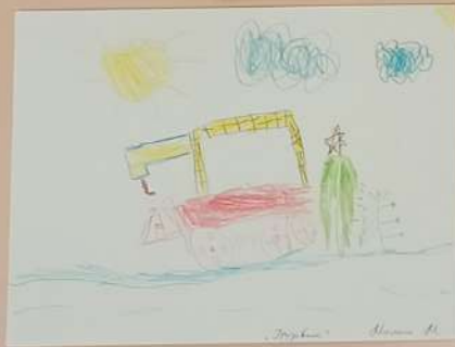
„Tropfen“ Seite 13