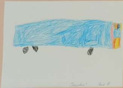
„Tropfen“ Seite 6