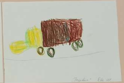
„Tropfen“ Seite 11